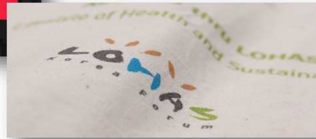
▶ 친환경 손수건사용 캠페인