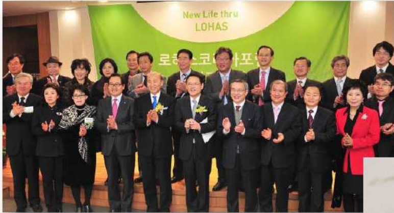
▶ (사)로하스코리아포럼 출범식(2012.02)